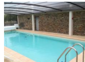
Piscine chauffée et couverte