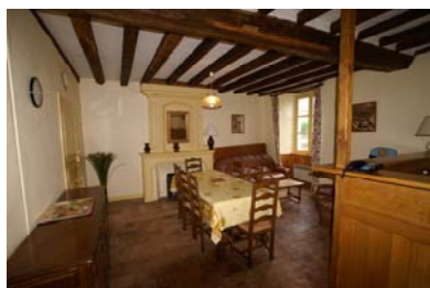
Gîte de Chenillé Changé