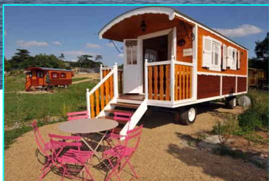
Les Roulottes du Moulin