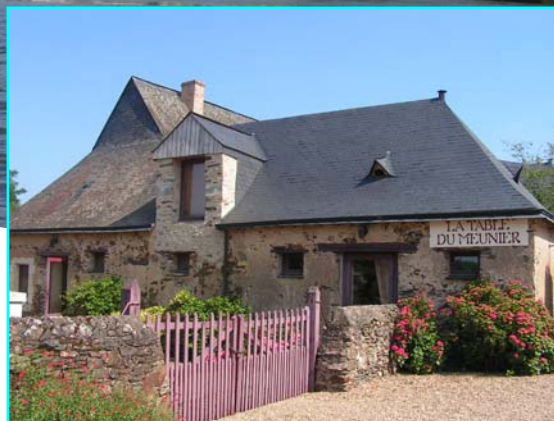
Restaurant La Table du Meunier