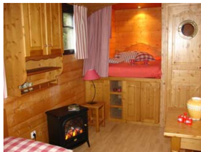
Intérieur d'une roulotte